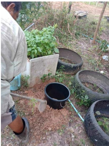
๒๓) ครัวเรือนที่ ๒๓