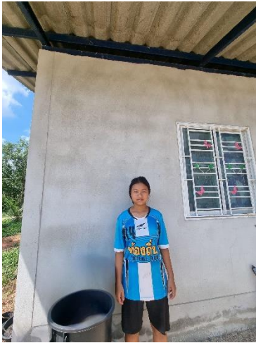
๓๕) ครัวเรือนที่ ๓๕