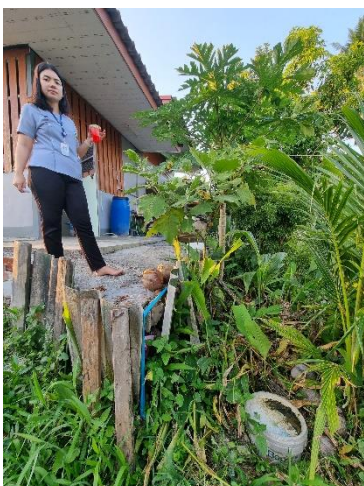
๒๔) ครัวเรือนที่ ๒๔