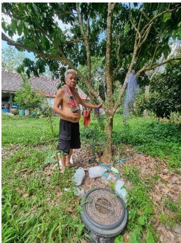
๓๘) ครัวเรือนที่ ๓๘