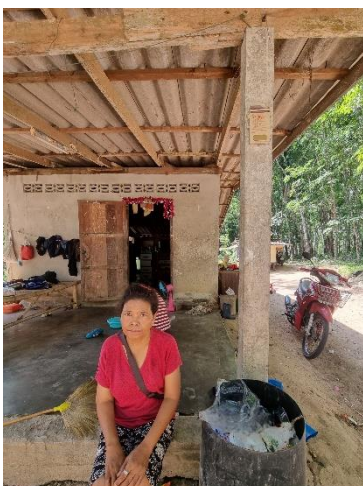
๓๐) ครัวเรือนที่ ๓๐