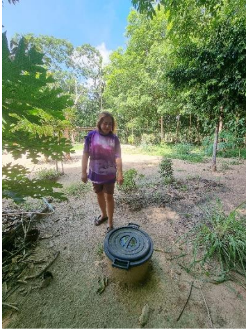
๒๘) ครัวเรือนที่ ๒๘