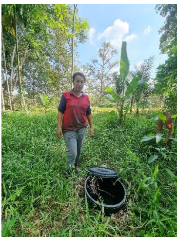
๓๓) ครัวเรือนที่ ๓๓