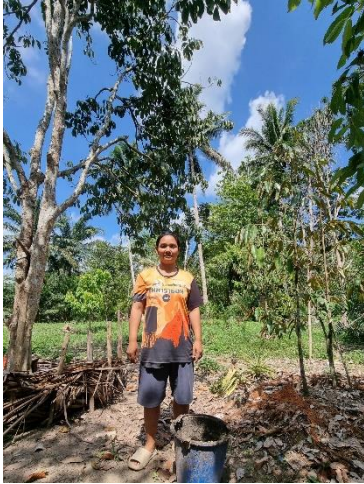
๓๗) ครัวเรือนที่ ๓๗