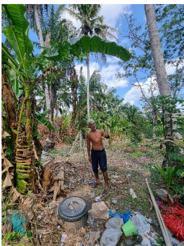
๓๙) ครัวเรือนที่ ๓๙