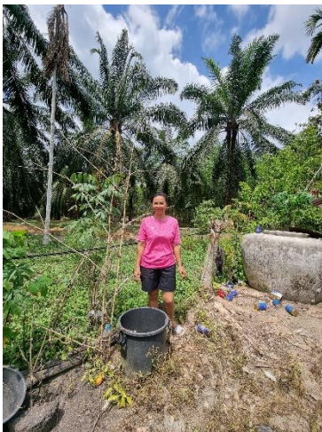
๔๗) ครัวเรือนที่ ๔๗