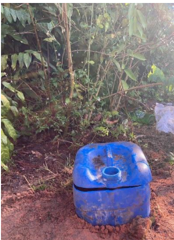
๑๕) ครัวเรือนที่ ๑๕