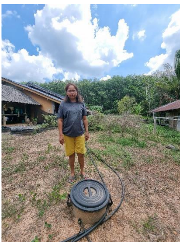
๔๘) ครัวเรือนที่ ๔๘