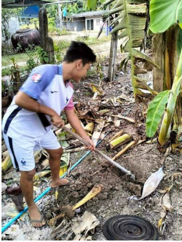
๒๒) ครัวเรือนที่ ๒๒