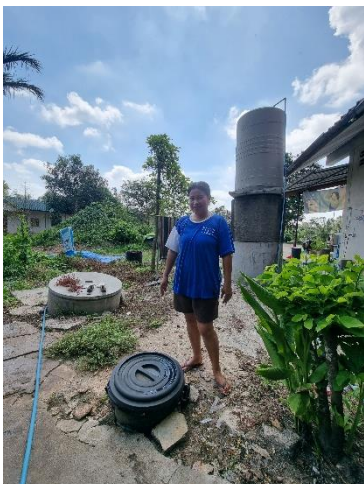
๓๖) ครัวเรือนที่ ๓๖