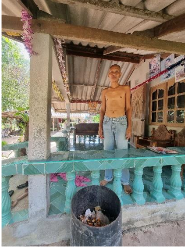
๓๑) ครัวเรือนที่ ๓๑