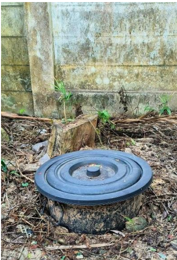
๑๔) ครัวเรือนที่ ๑๔