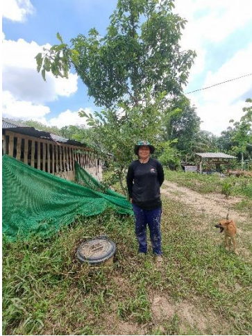
๔๖) ครัวเรือนที่ ๔๖