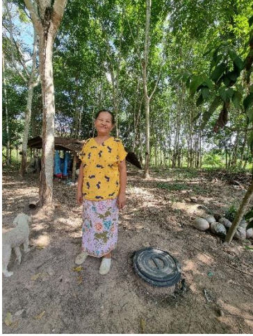
๓๔) ครัวเรือนที่ ๓๔