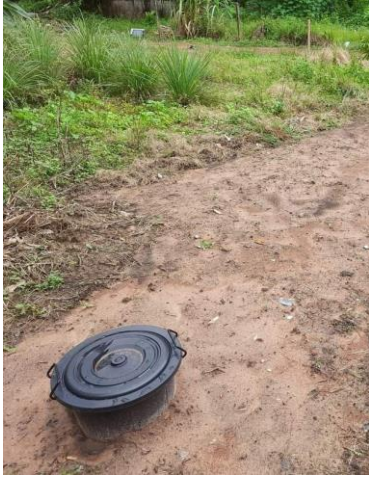
๑๓) ครัวเรือนที่ ๑๓