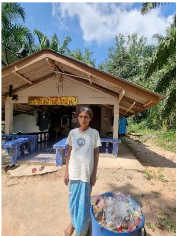
๓๒) ครัวเรือนที่ ๓๒