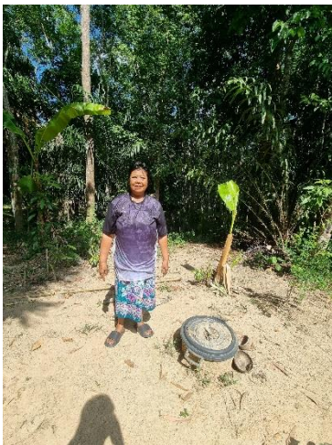
๒๙) ครัวเรือนที่ ๒๙